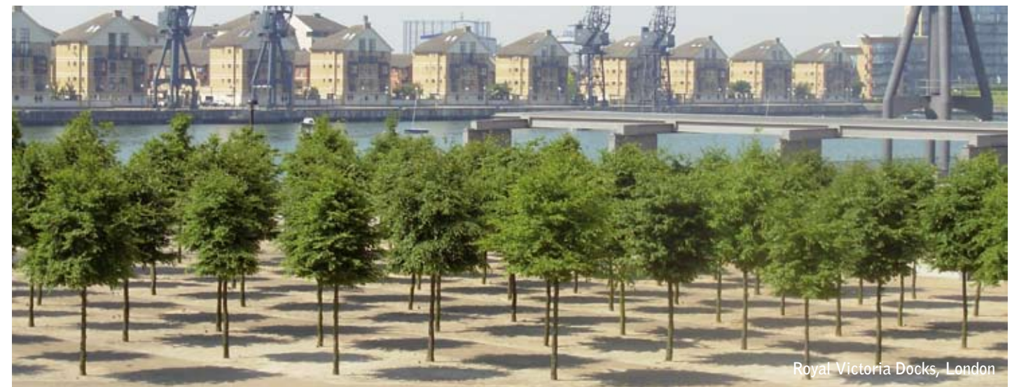
Royal Victoria Docks, London