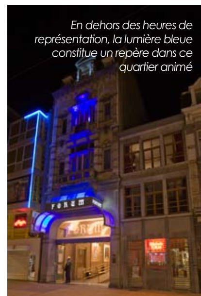
En dehors des heures de représentation, la lumière bleue constitue un repère dans ce quartier animé

Dans la rue, la marquise soulignée par des points lumineux contribue à l'atmosphère de fête. Détail piquant, la lampe à incandescence avec son rayon scintillant reste à ce jour imbattable pour cette application.